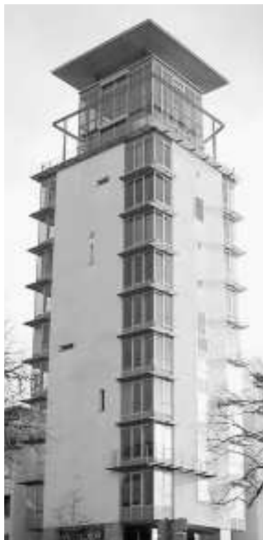
Das heutige Predigertor, ein Büro- und Geschäftsgebäude am Fahnenbergplatz

Von Hygiene konnte keinerlei Rede sein und schnell machte sich Ungeziefer breit, derer sich die Frauen durch die Fesseln nicht wehren konnten.