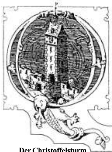
Der Christoffelsturm war ein Ort der Marter (Initiale von 1889)

Dieser Turm fungierte als Stadttor in Richtung Neuburg und befand sich bis zu seinem Abriss im Jahre 1704 am nördlichen Ende der damaligen Großen Gass – der heutigen Kaiser-Joseph-Straße, etwa dort, wo sich heute die Straßenbahnhaltstelle Siegesdenkmal befindet. Im Volksmund nannte man das Christoffelstor auch Michaels- oder Diebesthor und es diente nicht nur als Gefängnis, sondern auch als Hauptfolterstätte der Stadt Freiburg insgesamt. Die Folterungen wurden im angebauten Marterhäuschen durchgeführt. In diesem Gebäudekomplex wurde auch ein Großteil die Freiburger Hexen inhaftiert und vor allem gefoltert. Das Marterhäuschen musste im Jahre 1603, dem traurigen Höhepunkt der Freiburger Hexenverbrennungen, sogar erweitert werden, da es nicht mehr ausreichte. Dieser Anbau regte bei den Freiburger Bürgern größtes Interesse – wenn darin Folterungen stattfanden, schlichen viele Bürger an die Mauern des Marterhäuschens, legten ihre Ohren an, um den Schreien der Gefolterten zu lauschen. Man nannte das damals: „die Hexen singen lassen“.