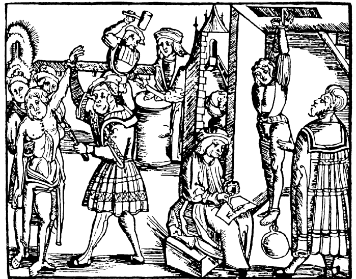
Um die Geständnisse zu erpressen wurden die Beschuldigten grausamen Torturen ausgesetzt.

Zeugen aller Art waren zugelassen und standen unter dem bedingungslosen Schutz der Gerichte. Die Namen der Zeugen blieben ungenannt. Die einzige Ausnahme: Es durften keine Todfeinde als Zeugen zugelassen werden, wobei nicht geschrieben stand, wer als Todfeind galt. Aussagen jeglicher Art und unbeachtet ihrer Herkunft wurden zugunsten der Anklage benutzt, selbst wenn sie noch so fragwürdig waren. Den Richtern waren dabei Exkommunizierte genauso recht und billig, wie bekannte Meineidige oder Mitschuldige. Ob Verfeindete, Verwirrte oder Kinder – JEDES Zeugnis wurde als gültig betrachtet, sofern es sich GEGEN die Beschuldigte richtete.