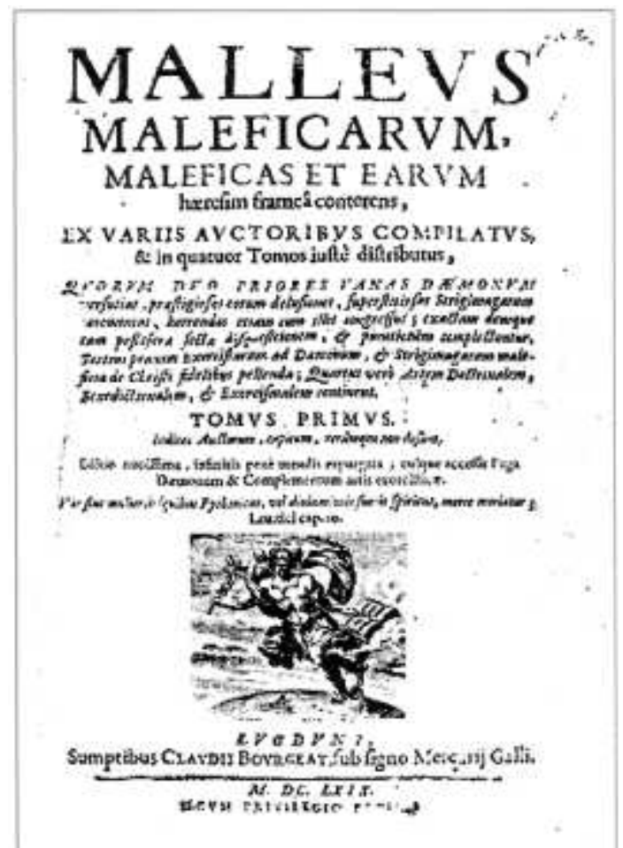
Hexenhammer (Malleus Maleficarum), 1487

Es reichte also aus, dass einfache Gerüchte über eine Frau, entstanden aus Neid, Streit, Angst oder Rache längerfristig kursierten, damit ein Richter Anklage erheben konnte. Oft klagten aber auch eifrige Bürger die Verdächtige selbst vor Gericht an, wobei keine Beweise hierfür erforderlich waren.