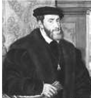
Kaiser Karl V. (1500-1558)

Im Jahre 1532 erließ Kaiser Karl V. auf dem Reichstag in Regensburg die „ peinliche Halsgerichtsordnung “, die Constitutio Criminalis Carolina als verbindliche Reichsgesetzgebung für die weltlichen Gerichte . Peinlich leitet sich hierbei von dem Wort Pein, im Sinne von Qual ab, dieses wiederum hat den Ursprung im lateinischen poena (lat. Strafe). Sie enthielt neben materiellem Strafrecht vor allem Prozessrecht. Auf sie stützte sich die Methode der peinlichen Befragung bei der Erwirkung von Geständnissen (=Urgicht).