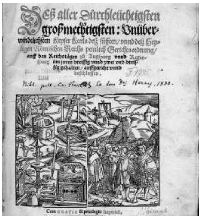
Titelblatt der peinlichen Halsgerichtsordnung Constitutio Criminalis Carolina

In der kommenden Ausgabe Wie erging es den Freiburgerinnen? Wie wurden die Prozesse geführt? Wo wurden die vermeintlichen Hexen inhaftiert?